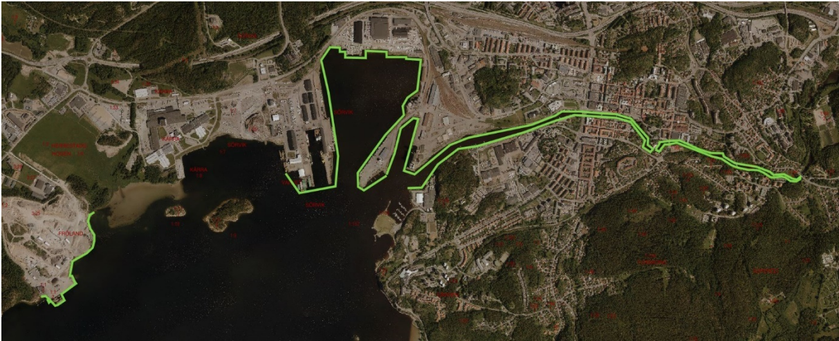
Bilaga: § 19 skiss gällande siktskymmande växtlighet